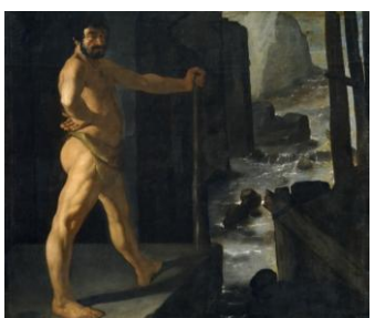
5º) Los establos de Augias