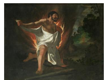
Muerte de Hércules