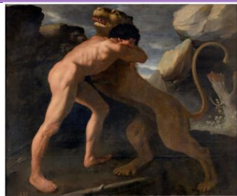
1º) El león de Nemea

Las Fuerzas de Hércules del extremeño Francisco de Zurbarán fueron pintadas en 1634 para el Salón de Reinos del palacio del Buen Retiro (Madrid). Se trata de diez cuadros mitológicos sobre los trabajos de Hércules , que se pueden admirar hoy en el Museo del Prado . La obra de Zurbarán es conocida por su temática religiosa y sus santos bellamente vestidos, por lo que estas diez obras sobre la figura mitológica de Hércules son la excepción.