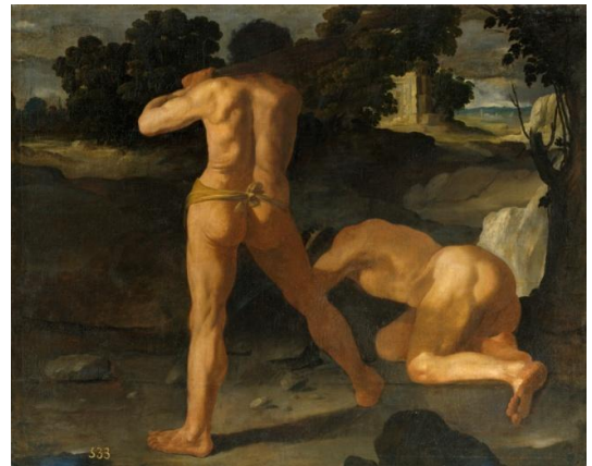
Hércules vence al rey Gerión