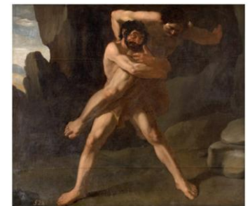
11º) Hércules y Anteo