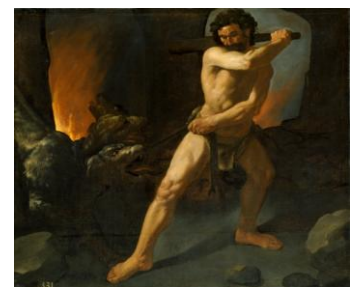
12º) El can Cerbero