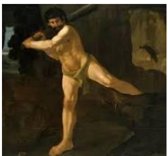
4º) El jabalí del Erimanto