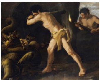
2º) La hidra de Lerna