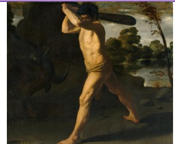
7º) El toro de Creta

Por tanto, mito, historia y arte se unen para conformar el escudo de Andalucía , símbolo de nuestra comunidad autónoma, que celebra su día el 28 de febrero , para conmemorar la fecha del referéndum del año 1980 que dio autonomía plena a nuestra comunidad andaluza.